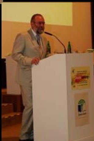
Národný garant certifikácie programu Zelená škola